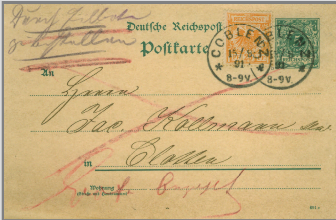
Klaucke-Stempel COBLENZ 15.8.1891, 8-9V. mit fünfstrahligem Zierstern und Kontrollbuchstabe „e“ in Schreibschrift auf Postkarte nach Clotten. Die Postkarte trägt den handschriftlichen Vermerk „Durch Eilboten zu bestellen“ und hat daher eine Zusatzfrankatur 25 Pfg.