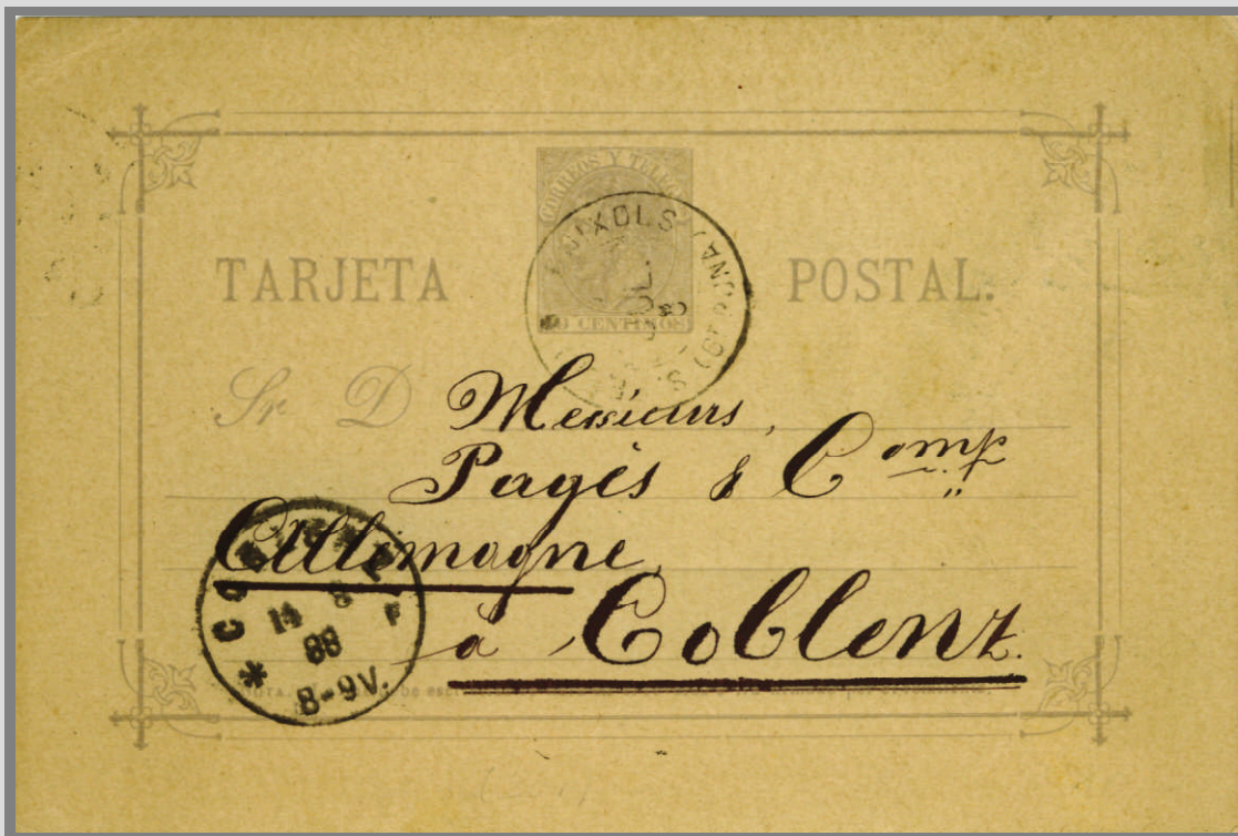
Klaucke-Stempel COBLENZ 14.8.1888, 8-9V. mit sechsstrahligem Zierstern und Kontrollbuchstabe „f“ als Ankunftsstempel auf Ganzsache aus Spanien. Nur der „f“-Stempel hat einen sechsstrahligen Stern, und er wurde nur als Ankunftsstempel eingesetzt. Er ist selten, und es sind nur wenige unterschiedliche Tageszeitangaben bekannt.