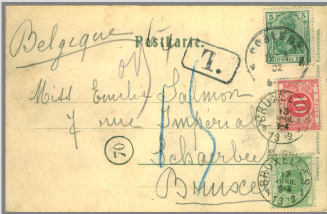
Klaucke-Stempel COBLENZ 12.04.1902, 5-6N. , Stern und Kontrollbuchstabe „d“ auf Ansichtskarte nach Belgien, dort mit 15 Cent Nachporto (belgische Portomarken) belegt. Der „d“-Stempel auf Marken DEUTSCHES REICH ist eine absolute Rarität. Marken mit dieser Inschrift (zuvor REICHSPOST) wurden am 01.04.1902 eingeführt.