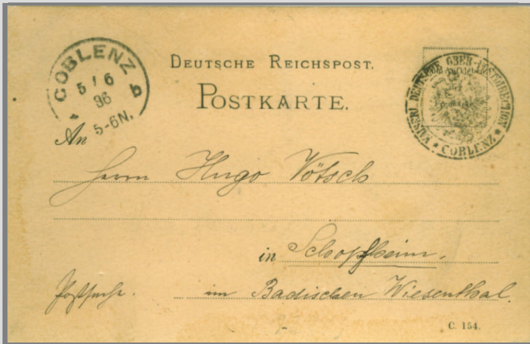
Klaucke-Stempel COBLENZ 5.6.1886, 5-6N. , Stern und Kontrollbuchstabe „b“ auf Postkarte mit der Formular-Nr. „C.154“ nach Schopfheim. Die Portofreiheit ergibt sich aus dem unten links vorhandenen Vermerk „Postsache“ und dem Dienstsiegel „Kaiserl. Deutsche Ober-Postdirection *Coblenz*“.